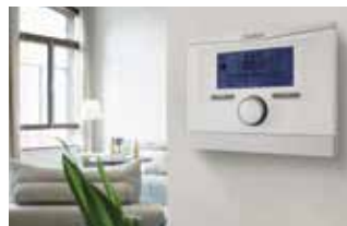
multiMATIC VRC 700 / 700f

Med en multiMATIC VRC 700 ges även möjligheten att ansluta Vaillant's internetkommunikationsmodul VR 921 till eloBLOCK. I multiMATIC app:en kan värmesystemet enkelt övervakas och justeras på distans.